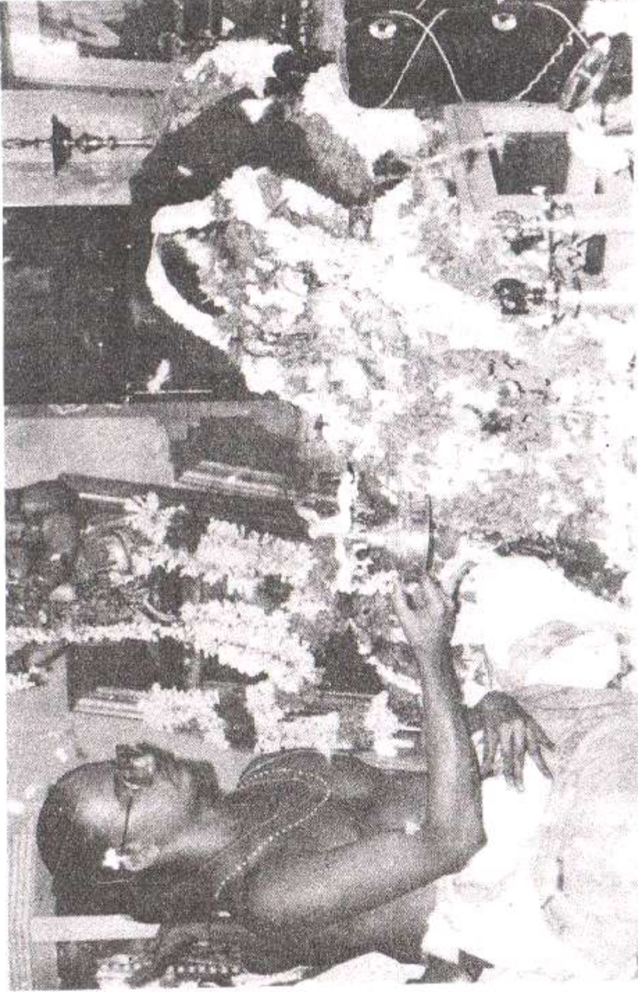
சென்னை, மேற்கு மாம்பலம் ஸ்ரீ அயோத்யா மண்டபத்தில் நடைபெற்ற 'ஸங்கீர்த்தன ஸப்தாஹம்' வைபவத்தில் ஸ்ரீ குருஜி பூஜை செய்யும் காட்சி.